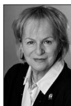
COLOMBE PRIVÉ Siège 4