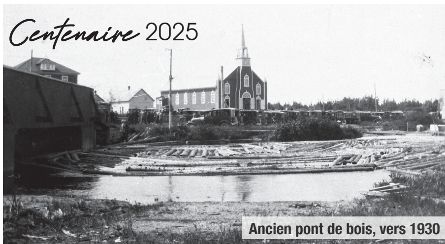
Ancien pont de bois, vers 1930

Bonne saison à tous les fondeurs et fondeuses!