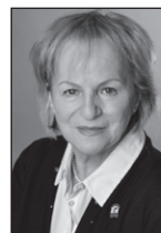
Colombe Privé Siège 4